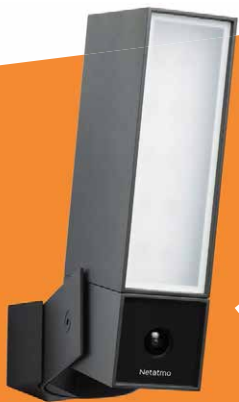
1 CÂMARA EXTERIOR NOC-PRO