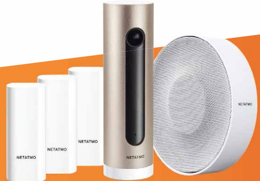
1 SISTEMA DE ALARME NBU-AS-PRO