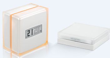
NTH-PRO TERMOSTATO INTELIGENTE 165,00 € 123,75 €