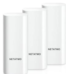
DTG-PRO SENSORES INTELIGENTES PARA PORTAS E JANELAS 99,99 € 74,99 €