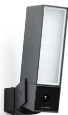
NOC-PRO CÂMARA EXTERIOR INTELIGENTE 274,99 € 206,24 €