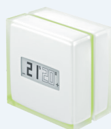
OTH-PRO TERMOSTATO MODULANTE INTELIGENTE 199,99 € 149,99 €