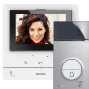
364614 KIT C100 X16E WI-FI MONITOR + L3000 566,19 € 424,64 €