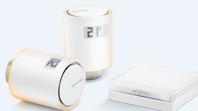
NVP-PRO PACK DE VÁLVULAS TERMOSTÁTICAS INTELIGENTES PARA AQUECIMENTO COLETIVO E URBANO 185,99 € 139,49 €