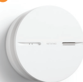
NSA-PRO-EU DETETOR DE FUMO INTELIGENTE 99,99 € 74,99 €