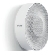
NIS01-PRO SIRENE INTERIOR INTELIGENTE 83,33 € 62,50 €