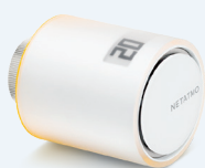
NAV-PRO VÁLVULA TERMOSTÁTICA INTELIGENTE ADICIONAL 75,50 € 56,63 €