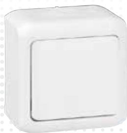
7 823 60