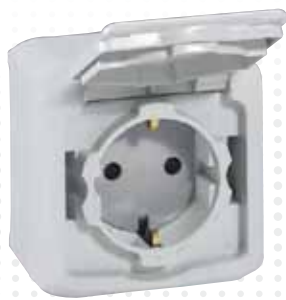
7 823 93