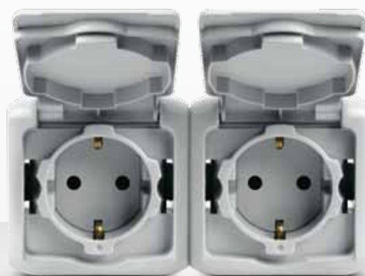
TOMADA DUPLA DE CORRENTE