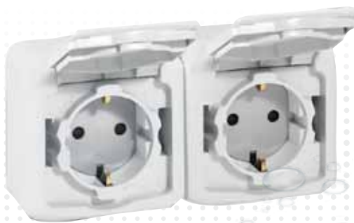
7 823 94