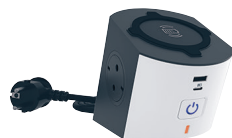
6 945 06