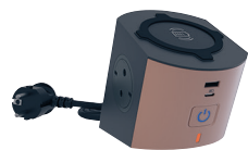
6 945 00