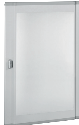
0 212 61

IP 43 - IK 08 com junta ref. 0 201 30 e porta