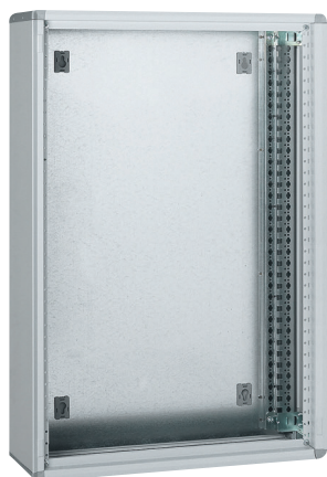
0 204 01

quadros de distribuição metálicos, celas de cabos e portas - 24 e 36 módulos por fila