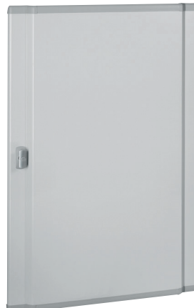
0 212 51