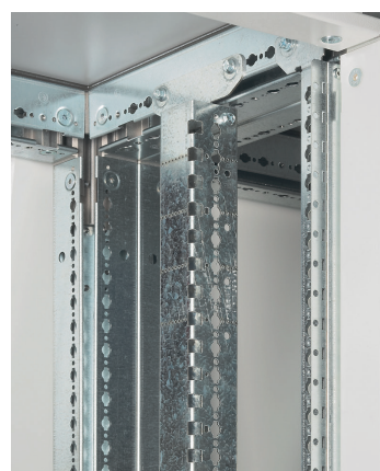
0 205 12