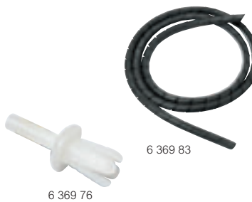
6 369 76