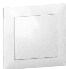
7 211 06 + 7 215 01