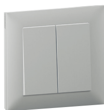
7 213 08 + 7 215 11