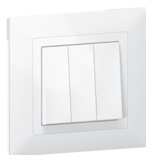
7 211 03 + 7 215 01