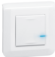
0 777 01LA