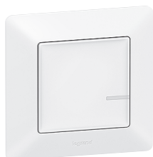
7 521 84A