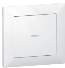
7 221 71 + 7 215 01