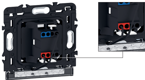
Exemplo de lâmpada montada no suporte e ligada com comutador