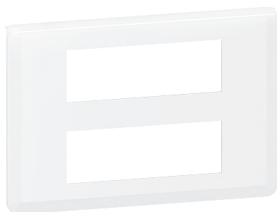
0 788 36L