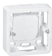
0 802 80