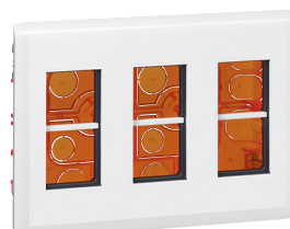
0 788 73L