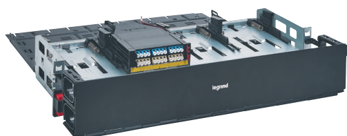
Painel 0 321 76 equipado com support 0 321 38 e de cassetes slim 0 321 69 e 0 321 70

painéis fibra ótica Alta Densidade 19" - 1/2/4 U