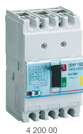
4 200 00