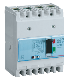
4 200 10