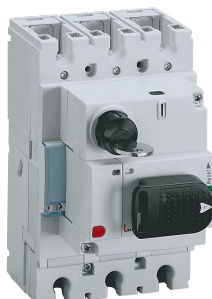
4 210 00